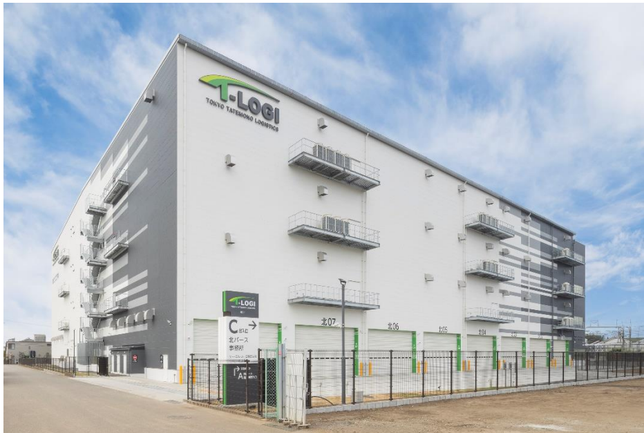
< 「T-LOGI 寒川」 外観 >