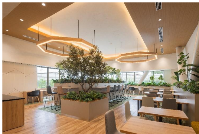
< 「T-LOGI 寒川」 内観 (左：倉庫内、右：休憩所) >